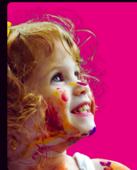
Johdatus lapsen oikeuksiin – ...vaa lapsen oikeuksien...

Koulutuskokonaisuus kannattaa aloittaa lapsen oikeuksien johdatusosiosta. Lisäksi kokonaisuus sisältää ilmiölähtöisiä koulutuksia ja eri alojen ammattilaisille suunnattuja koulutuksia.