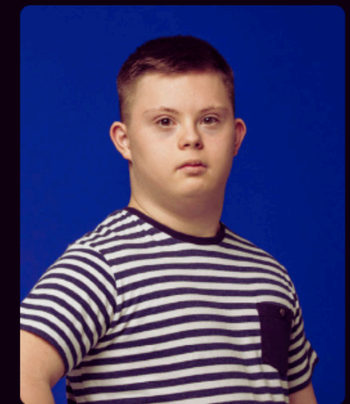
Lapsen oikeudet – Myös haavoittuvassa asemassa ol...