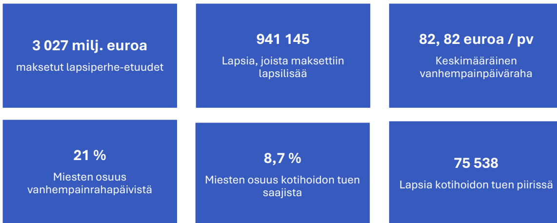
Kuvio 1. Lapsiperhe-etuuksien avainluvut vuonna 2024 (Kela) 85