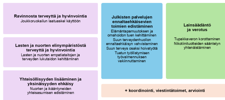
Kuva 1. Terveydeksi -ohjelman toimenpidekokonaisuudet ja toimenpiteet.